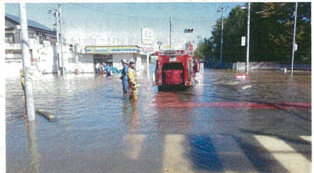
台風21号の襲来で浸水した県道交差点(北本市朝日地区)

近年、経験したことのないようなゲリラ豪雨や台風などにより、各地で河川が越水・溢水し、浸水被害が多発しています。北本市においても昨年10月、関東を直撃した台風21号が原因となり、朝日地区において大規模な浸水被害が発生し、県道が通行止めになったほか、大規模集合住宅であるワコーレロイヤルガーデン(RG)をはじめとする地域住民の日常生活に大きな影響が出ました。(裏面へ続く)