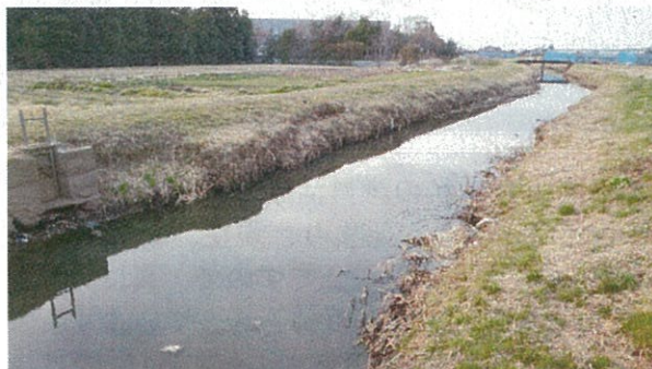
新年度に改修される赤堀川

こうした意見交換などを踏まえ、赤堀川の改修を県に強く要望してきました。先月、 県が発表した平成30年度予算案では、赤堀川の改修として、浚渫して、水深を確保することや右岸側（朝日地区側）の護岸整備の費用などが盛り込まれました。 今後、地域住民の安全のため、長期的視点に立つての抜本的な改修を引き続き、要望していきます。